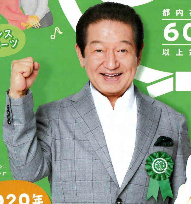
縁ジョイサポーター 草野 仁