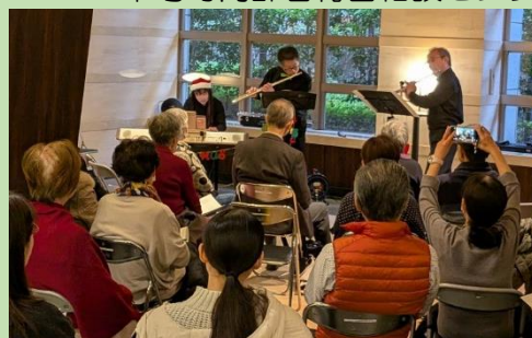
ピアノとフルートの演奏に聴き入る来場者