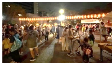
若宮町自治会：若宮町こども祭り (9月)