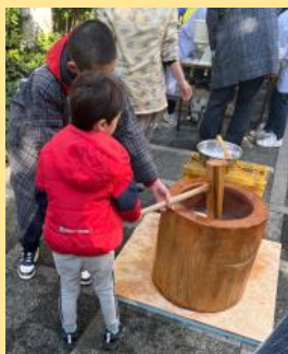
助け合いながら餅をつく子どもたち