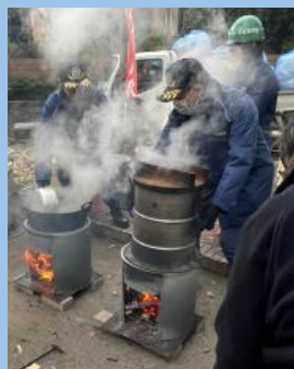
薪を使った竈での炊き出し