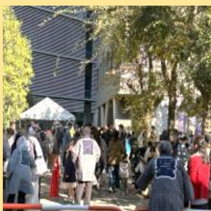
会場は、多くの来場者で賑わっていました