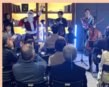
ヴァイオリンとチェロの演奏にサンタも登場