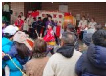
牛込筆筥地域まつり(1月)