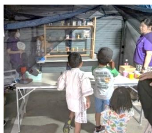
横寺町交友会：秋祭り (9月)