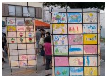
新小川町自治会：灯りまつり (7月)