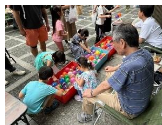
西五軒町町会：お楽しみ会 (6月)