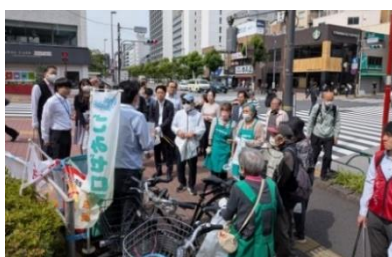
地域ごみゼロ運動 (5月&11月)