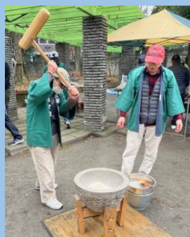
多くの方が餅つきを体験