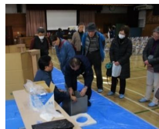
携帯トイレの使い方