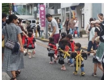
神楽坂通りでのお祭り (9月)