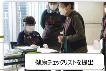
健康チェックリストを提出