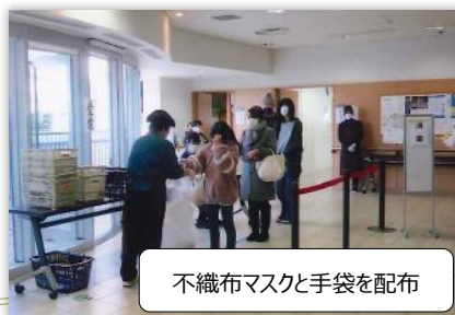
不織布マスクと手袋を配布