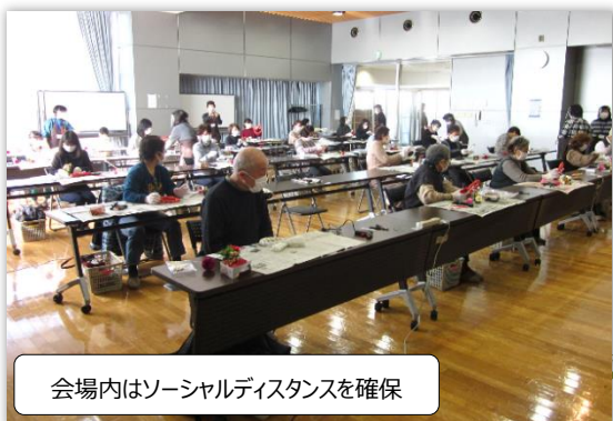
会場内はソーシャルディスタンスを確保