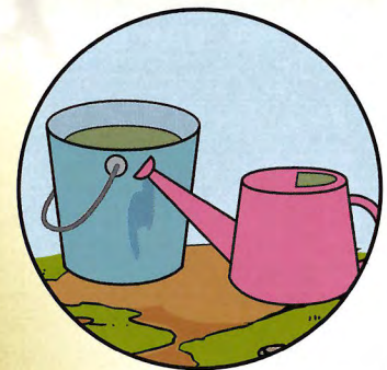
雨ざらしのバケツ・じょうろ