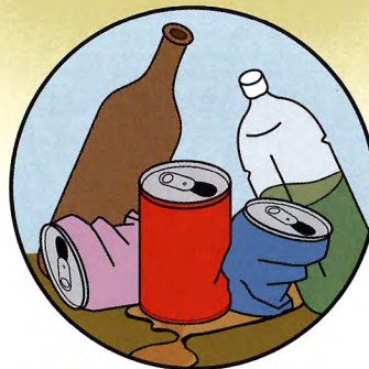
空き瓶・缶・ペットボトル