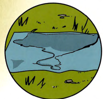
ビニールシートのくぼみ